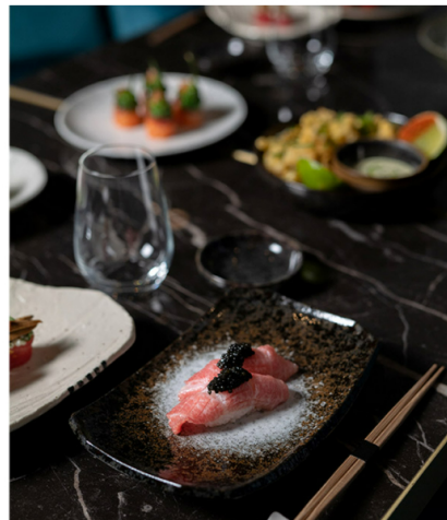
Restaurant Yakuza by Olivier Paris.