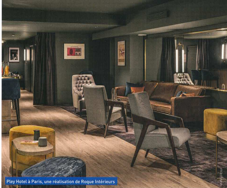
Pley Hotel à Paris, une réalisation de Roque Intérieurs

laisser un peu libre cours à l'architecte d'intérieur pour qu'il puisse s'exprimer, qu'il existe un fil rouge cohérent du début à la fin. Mes projets les plus réussis sont ceux pour lesquels j'ai eu carte blanche. Il faut aussi pouvoir s'appuyer sur de bonnes équipes de conception et d'exécution.