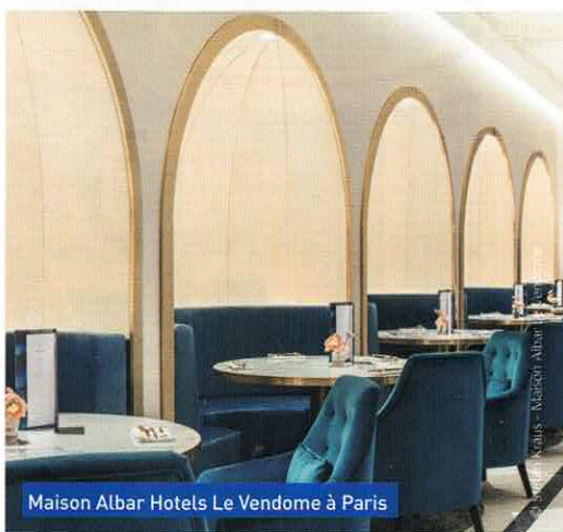
Maison Albar Hotels Le Vendôme à Paris

Nos fournisseurs et nos usines partenaires sont impliqués en matière de développement durable et de recyclage des matières. Tous les secteurs travaillent sur l'écoresponsabilité, par exemple, les fabricants de robinetterie mettent au point des équipements pour réduire la consommation d'eau, les →