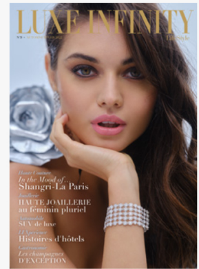
Automne - Hiver 2022