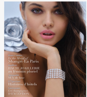
Automne - Hiver 2022

Facebook · Twitter · Pinterest · LinkedIn