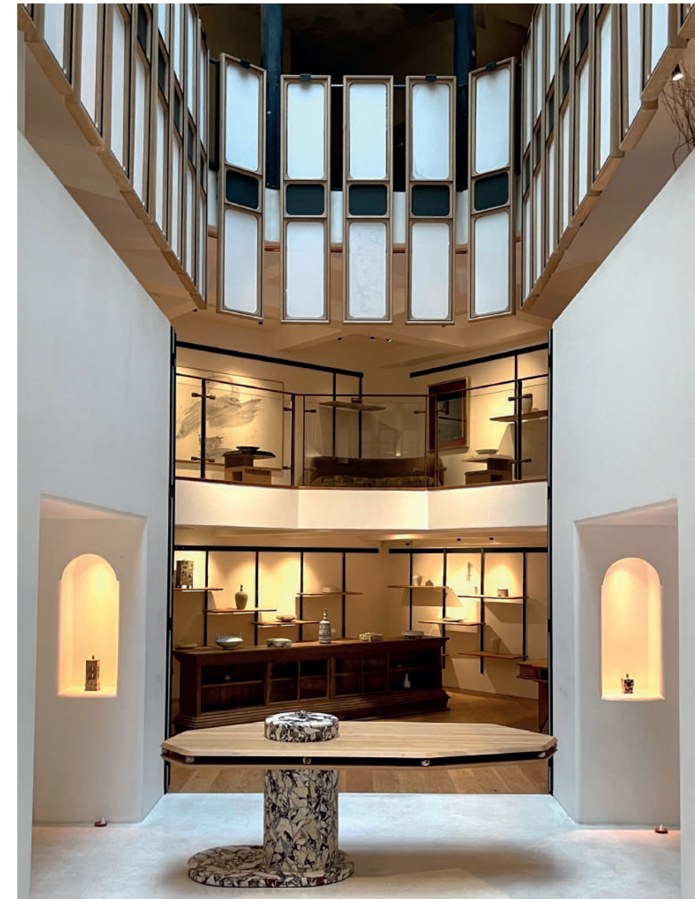
OGATA - ogata.com