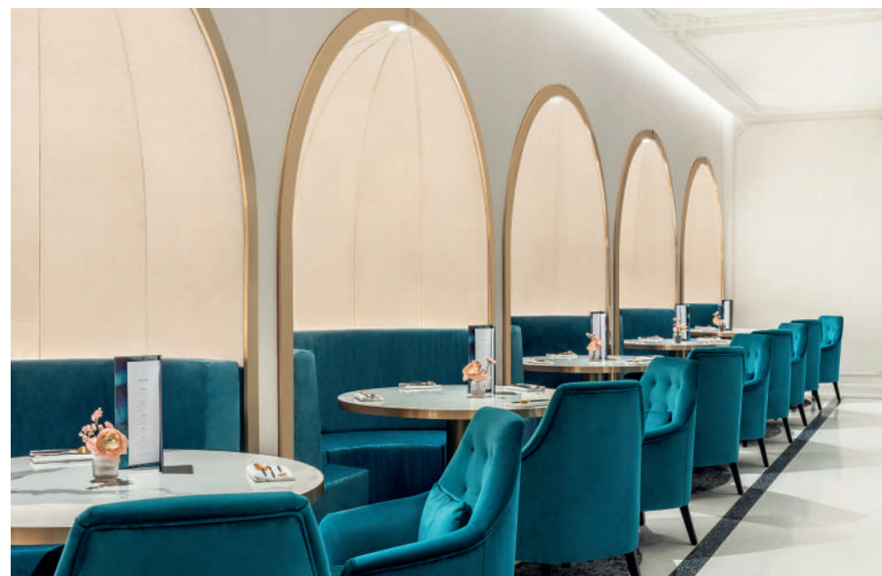
LE VENDÔME, Brasserie Le Lyon d'Or - maison-albar-hotels-le-vendome.com

The peacock and celestial blue, the emerald green, in contrasting touches, add verve to a backdrop of different hues of whites, greys and beiges, brought together by the harmony of textured and woven materials. A palette of elegant shades restore this former inn to its former glory when it housed a cabaret. The custom-designed furniture, lighting and accessories give a streak of craziness to this 5-star establishment that “revives a forgotten era”. The Vendôme, with its serene voluptuousness, luminous spaces and new codes of luxury, could very well become a symbol of modernity rooted in the splendour of yesteryear. ▷