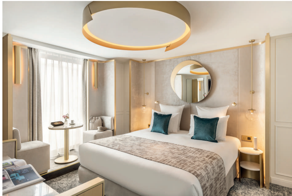
LE VENDÔME - maison-albar-hotels-le-vendome.com

Le bleu paon et céleste, le vert émeraude, en touches contrastées, réveillent une toile de fond de blancs nuancés, de gris et beiges, réunis par l'harmonie des matières texturées et tramées. Une palette de teintes élégantes ravive le lustre de cette ancienne auberge, dotée autrefois d'un cabaret. Le mobilier, les luminaires et les accessoires, conçus sur mesure, ajoutent un grain de folie à cet établissement 5 étoiles qui « redonne vie à une époque oubliée ». Le Vendôme, avec sa volupté tranquille, ses espaces lumineux et ses nouveaux codes du luxe, deviendra, peut-être, un symbole de modernité prenant racine dans les fastes d'hier.