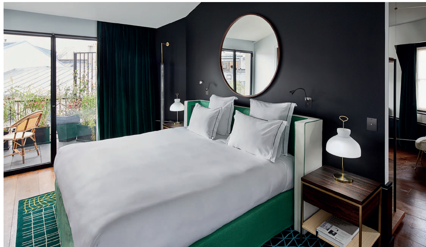
LE ROCH HÔTEL & SPA - leroch-hotel.com

A stone's throw from Place Vendôme, the Le Roch is a hotel with the air of a 5-star family home. The deep blue that has become the hallmark of its designer is ubiquitous. The rooms alternate between soft and intense colours, while the amenities include a bar opening onto the green oasis of the patio, a restaurant and a tree-filled terrace. Elegant yet surprising in its combination of materials, the gaze is drawn to the ceilings straight out of a British gentlemen's club. The offbeat classical spirit comes through in the wood panelling on the walls, a nod to chic Parisian apartments but reworked with contrasting frames, the lobby's exotic wood mosaic, the printed carpet or the library featuring a lava stone fireplace, a material also found in the swimming pool and the spa. ▷